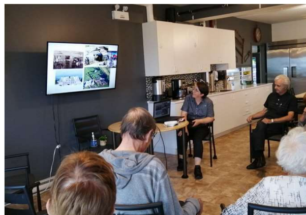
Groupe lors d'un atelier en direct « Du Musée à votre foyer », octobre 2021, photo : Facebook Les Quartiers A inc.

Série de 8 ateliers virtuels en direct composée de 32 capsules audiovisuelles Présentation, commentaires et animation d'une discussion par une médiatrice culturelle 208 participants entre juin et décembre 2021 17 établissements ont téléchargé la trousse de médiation pour une écoute en autonomie