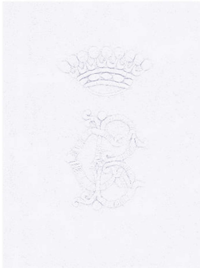
Monogramme rehaussé d'une couronne, broderie sur l'une des serviettes de table du couple Aubert de Gaspé et Saveuse de Beaujeu, vers 1832

Nous remercions sincèrement les donateurs qui ont contribué à l'enrichissement de la collection matérielle.