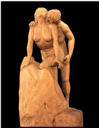
Don de Fernand Boudreau, Sculpture de Jacques Bourgault

La collection matérielle est majoritairement composée d'objets ethnographiques et de documents d'archives. Elle témoigne des pratiques culturelles et des modes de vie des milieux ruraux et urbains, principalement du 20 e siècle.