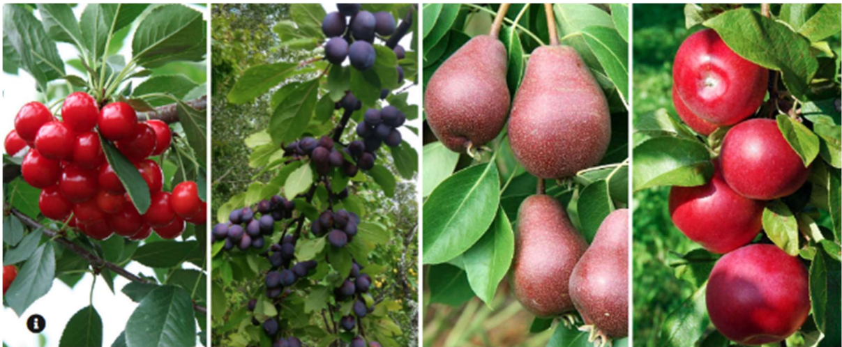
Un patrimoine à croquer

Par des témoignages, des documents d'archives, des photos et des extraits vidéo, cette exposition plongera le visiteur au cœur de l'histoire, des paysages et de la diversité fruitière de la Côte-du-Sud. Actuellement en préparation, Un patrimoine à croquer est une exposition du Musée de la mémoire vivante qui sera hébergée par Musées numériques Canada. Elle sera disponible sur le site de Musées numériques Canada au cours de l'année 2023.